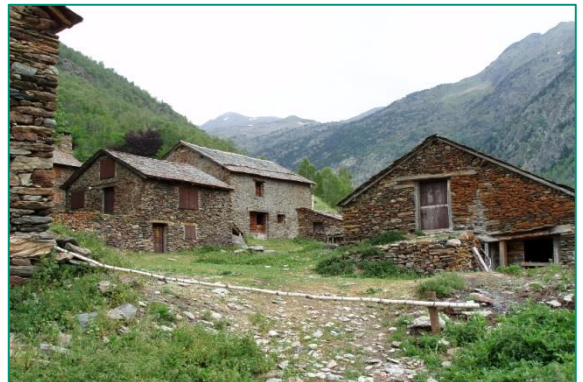
Bordas de Noarre.