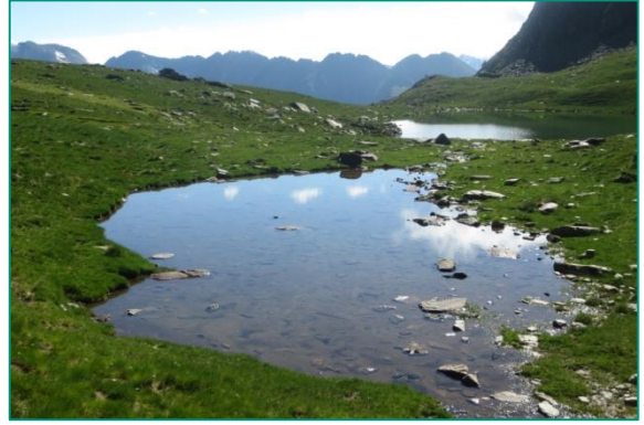
Pequeño lago en la zona de Certescan.