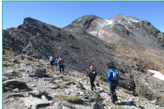
Ascendiendo a la Pica d'Estats.