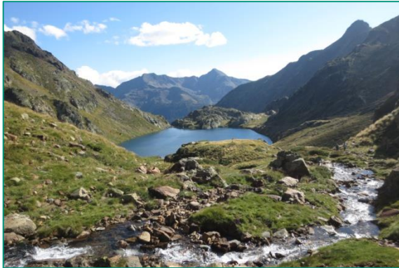
Estany de Sotllo, cerca del refugio Vallferrera