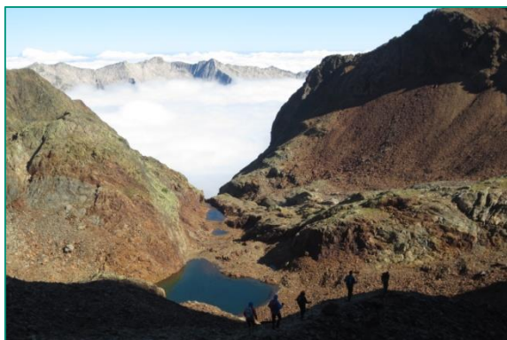
Coma d'Estats cerca del refugio de Pinet.