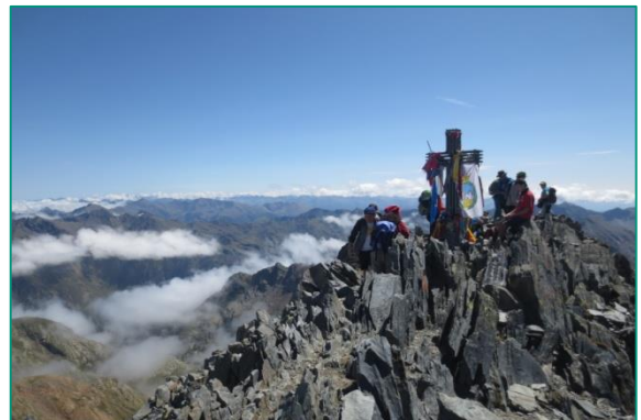
Cima de la Pica d'Estats (3.143m).