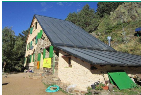
Refugio de Vallferrera.