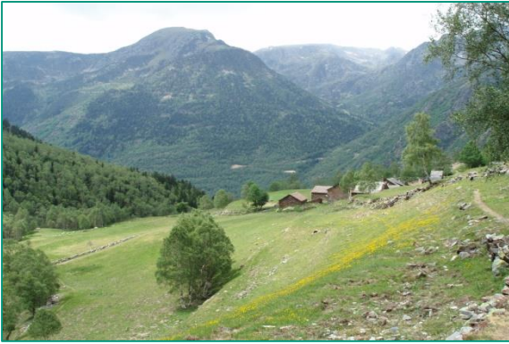
Valle de Tavascan.