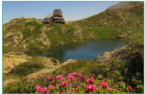
Refugio de Pinet, en la vertiente francesa.