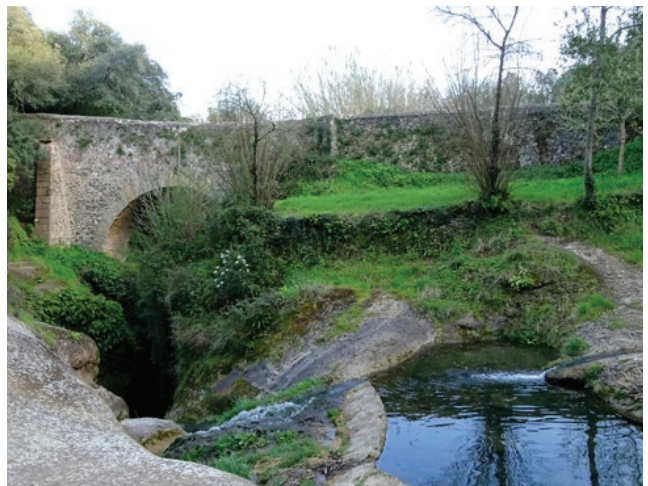
El volcán del Puig d'Adri