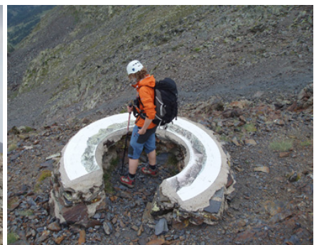
Pico de Cataperdís (2.806m) y pico de Arcalís (2.776m)