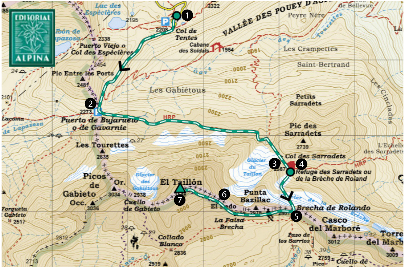
EDITORIAL ALPINA. Ordesa y Monte Perdido. Parque Nacional. 1:40.000.